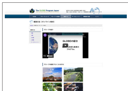
オンライン教材を公開しているウェブサイト